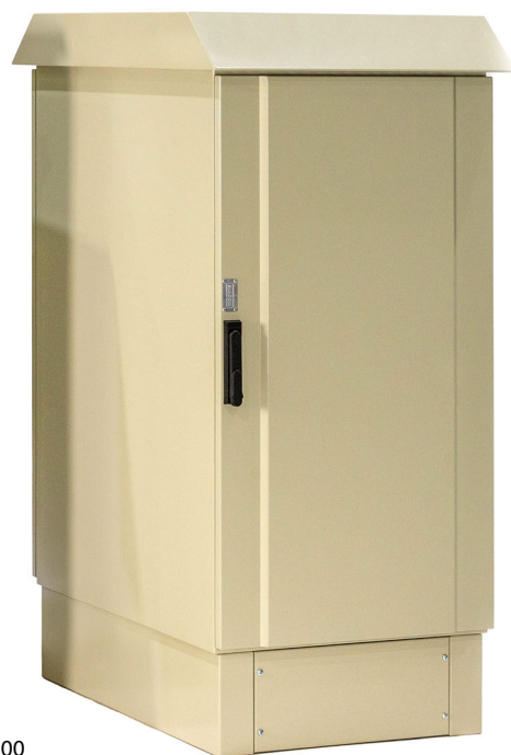
24U Fondo 900