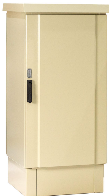
24U Fondo 600