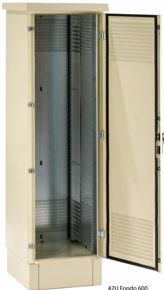
42U Fondo 600